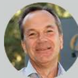
Stefan Entner Technical Services & Consulting OneVision Software AG